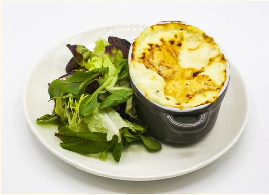
Jus de fruits Pièces apéritives

Gratin de ravioles à la crème et emmental