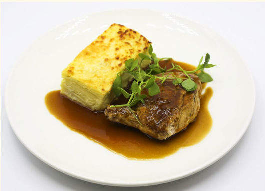
Volaille rôtie sur peau et son jus au thym gratin dauphinois

Gratin de ravioles à la crème et emmental